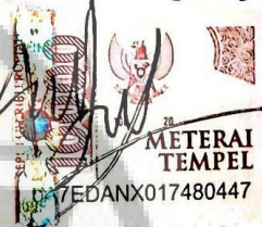
Intania Aulia Nurfauziah