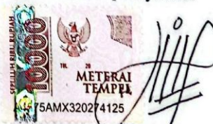
Ardicha Ayu Wiyanti

Surabaya, 10 Mei 2025 Yang membuat pernyataan