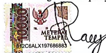
NAUFAL RAFI NURIMANSYAH