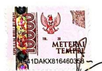
ANGEL SEPIETA PHELUPHESI