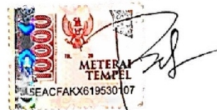
Rodhi Fawwaz Robbaniy

Surabaya, 17 Februari 2024 Yang membuat pernyataan