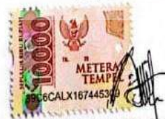
Winda Audina Nurkumairoh