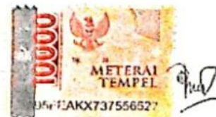
M Rizaldi Pratama

Surabaya, 27 Januari 2024 Yang membuat pernyataan,