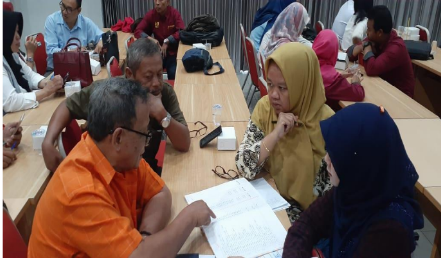
Gambar 2. Wawancara dengan Ketua dan pengarah BKM Ploso Maju Sejahtera