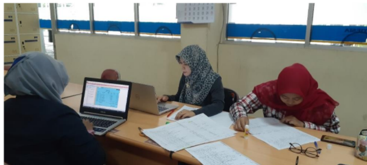
Gambar 4. Pendampingan Penyusunan Laporan Keuangan BKM Ploso Maju Sejahtera

Adapun dokumentasi untuk memberikan solusi permasalahan dan pendampingan dalam penyusunan laporan keuangan BKM Ploso Maju Bersama yang dilakukan oleh Tim ada pada gambar 4 berikut ini: