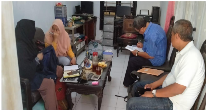
Gambar 3. Penelusuran dan pengambilan data cash flow dengan Ketua BKM Ploso Maju Bersama

Selanjutnya setelah permasalahan utama ditemukan tim melakukan kunjungan ke kantor pengurus BKM Ploso Maju Bersama di Jalan Bogen No.4 Tambak Sari Surabaya. Tim melakukan penelusuran data keuangan ( cash flow ) yang dimiliki oleh BKM. Kegiatan di atas didokumentasikan seperti terlihat pada gambar 3 di bawah ini: