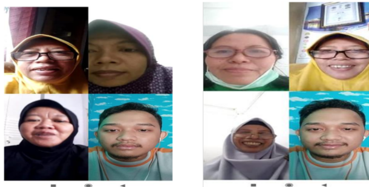
Gambar 4. Pemberian Materi Pembukuan Sederhana

c. Membantu menyelesaikan masalah terkait permasalahan pembukuan dengan pemberian materi terkait pembukuan sederhana serta contoh pembukuan transaksi keuangan.