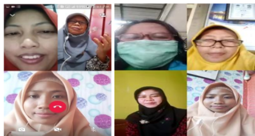
Gambar 2. Penjelassann Materi Pemasaran Online

Kegiatan ini dilakukan mulai bulan Juni 2020. Kegiatan dimulai dengan cara mengupload materi melalui grup WA, dan selanjutnya memberikan penjelasan melalui video call dengan cara mengundang anggota UMKM secara bergiliran, sehingga semua anggota UMKM secara keseluruhan mendapatkan penjelasan materi baik terkait dengan pemasaran online maupun pembukuan transaksi keuangan. Setelah para UMKM mendapatkan penjelasan materi video call selanjutnya mereka dipersilahkan untuk bertanya melalui grup WA, sehingga diskusi yang terjadi antara dosen pendamping dengan anggota UMKM dilakukan melalui grup WA, dan beberapa anggota juga bertanya melalui panggilan WA. Obrolan melalui WA ini sudah dirasa sangat cukup dalam keadaan pandemi ini. Memang banyak kendala di pelaksanaan ini, dikarenakan gangguan sinyal dan keterbatasan waktu dan pulsa serta masih banyak UKM yang belum siap dengan sistem aplikasi ini. Dibawah ini kami sertakan materi pemasaran online beberapa screnshoot obrolan di group WA dalam pendampingan kepada UKM.