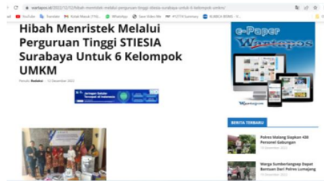
Gambar 10: Wartapos.id

http://www.radarhukumpos.com/2022/12/hibah-program-insentif-pengabdian_13.html?m=1