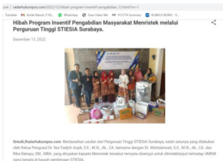
Gambar 9: Radarhukumpos.com Sumber:

Kegiatan pengabdian kepada masyarakat dipublish di media massa nasional, dipublish pada 2 (dua) media massa nasional yaitu radarhukumpos.com (gambar 8) dan wartapos.id (gambar 9). Berikut link dari masing-masing media massa nasional: