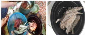
Gambar 4: Proses Pencabutan Tulang dan Duri Ikan

Di samping itu, limbah ikan bandeng berupa duri serta tulang disajikan dalam gambar 4.