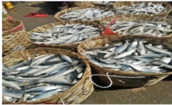
Gambar 1: Hasil Panen Ikan Bandeng di Gresik

Penduduk wilayah Gresik rata-rata bekerja sebagai petani tambak. Bandeng ( Chanos chanos ) merupakan salah satu jenis ikan yang dibudidayakan di daerah Gresik. Selain itu bandeng merupakan icon kota Gresik dimana pasar tradisional dan lomba ikan bandeng diadakan setiap tahun selama bulan ramadhan. Potensi pasar ikan bandeng di Gresik sangat tinggi sebagai makanan yang dinilai mahal tidak terlalu asin namun memiliki cita rasa yang lebih gurih serta tidak mudah hancur saat proses masak. Ikan bandeng merupakan ikan kelas menengah atau tinggi dari segi harga. Di bidang perikanan, produksi perikanan di Kabupaten Gresik sebesar 47.895.18 ton sedang areal budidaya ikan seluas 23.838,02 Ha. Hasil panen ikan bandeng disajikan dalam gambar 1 berikut.