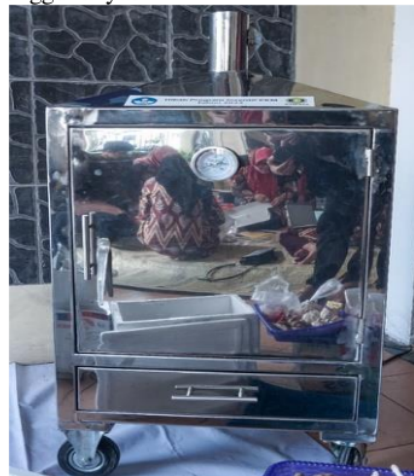
Gambar 7: Mesin Pengasap Ikan Bandeng

Guna terciptanya hasil teknologi saat proses pengasapan yang dinilai ramah terhadap lingkungan. Untuk tingkat keamanannya pada fungsi tubuh manusia seperti mata, hidung, dan paru-paru, maka alat pengasapan ini mampu mengurangi jumlah asap. Alat ini ergonomis, mobile, dan portabel untuk membantu UKM. Alat ini berbentuk seperti almari, kokoh dan ramping berdimensi P x L x T sama dengan 100 cm x 50 cm x 150 cm dengan berat sekitar 70 kg. Alat ini mampu mengasap ikan bandeng 1.000 ekor kerang @ 10 gram dengan waktu pengasapan 45 menit. Secara keseluruhan alat ini mengurangi jumlah asap dan polusi yang mengganggu di lokasi pengasapan ikan sehingga meningkatkan keamanan, kenyamanan, dan kesehatan bagi penggunaannya.