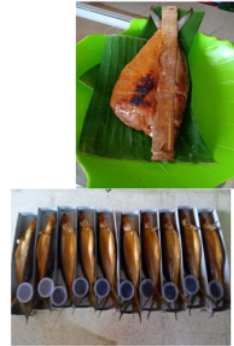
Gambar 2: Otak-otak Bandeng dan Bandeng Asap MM Gresik

Hasil panen ikan bandeng yang berlimpah, apabila tidak segera dimanfaatkan maka akan membusuk. Ikan bandeng selain digoreng atau dibakar, bisa diolah menjadi aneka olahan ikan bandeng seperti disajikan dalam gambar 2.