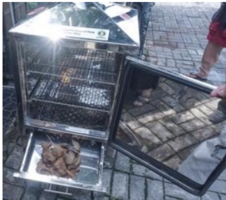
Gambar 8: Mesin Pengasap Ikan Bandeng (Bagian Dalam)