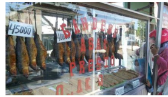
Gambar 5: Tempat Penjualan Otak-otak Bandeng

asap. Harga jual otak-otak bandeng dan bandeng asap Rp50.000 perekor. SDM yang membantu dalam proses produksi sebanyak 5 orang. Pada bagian pembersihan ikan dan cabut tulang ikan sebanyak 2 orang. Bagian pengolahan dan pengasapan sebanyak 3 orang. Permintaan otak-otak bandeng dan bandeng asap meningkat sebesar 75% setiap hari pada bulan puasa dan menjelang hari raya Idul Fitri.