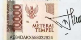
Nurul izza indah harini