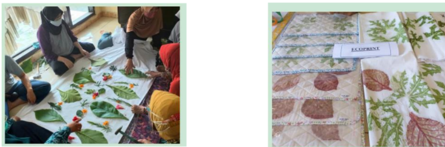
Gambar 1.5 Ecoprint awal