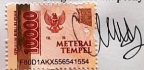
Corrysa Mega Novidintan