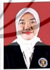
Sifa'ul Mujahadatun Nafsi