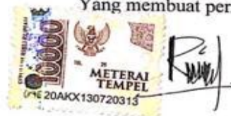
Reza Puspita Devi