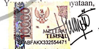
Novita Endria Ningrum