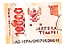
IRMA AYUNI RIZKI