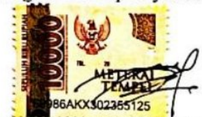
ANISSA DWI WAHYUNINGTYAS