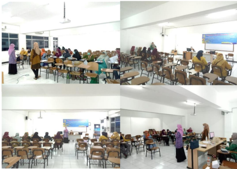
Gambar 3. Kegiatan Pengabdian Masyarakat

Kegiatan tahap ini dilakukan pada bulan Juni 2022. Pada tahap ini para pelaku usaha UMKM “Kali Kepiting Sejahtera” menerima materi terkait pendampingan terkait pencatatan keuangan usaha hingga penyusunan laporan keuangan. Materi yang diberikan pada kegiatan ini dilakukan secara tatap muka dan berdiskusi dua arah yang diikuti oleh 10 UMKM. Peserta diberi kesempatan untuk melakukan tanya jawab dan diskusi dengan dosen pendamping. Gambar 3 berikut merupakan dokumentasi pelaksanaan pengabdian masyarakat terkait penyusunan laporan keuangan.