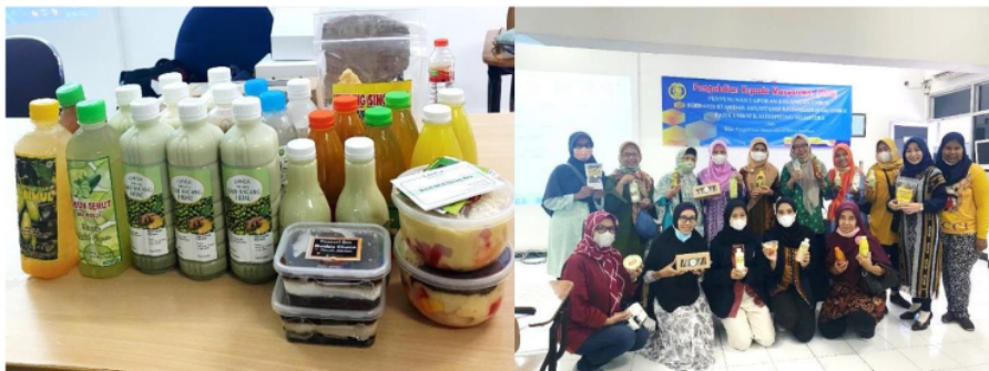
Gambar 1. Produk UMKM Kali Kepiting

Berdasarkan observasi di lapangan, mitra dalam kegiatan pengabdian adalah UKM Kali Kepiting, Kelurahan Pacar Kembang, Kec. Tambaksari, Kota Surabaya merupakan salah satu UKM yang memiliki potensi untuk dikembangkan. UKM Kali Kepiting merupakan UKM yang anggotanya ibu-ibu yang membuat aneka macam makanan dan minuman antara lain camilan, cathering , kue, minuman tradisional dan aneka sirup. Contoh produk dari UMKM Kali Kepiting dan nama-nama UMKM Kali Kepiting tersaji pada Gambar 1 dan Tabel 1 berikut.