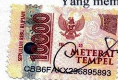
Putri Amelia Kusuma Tahery

Surabaya, 7 Januari 2023 Yang membuat pernyataan.