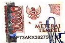
Ila Putri Sumita