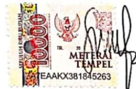
Wulan Suci Prihayu