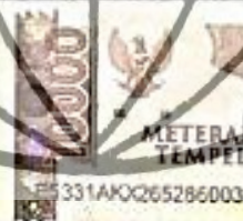
RISKY SHELA NOVIANA