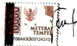
Fitria Zahrotul Laila