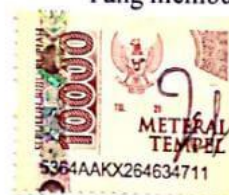
INDAH CAHYA FIRDAUSY