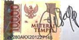
ANISA RISQANA PUTRI

Surabaya, 17 September 2022 Yang membuat pernyataan,