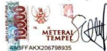
Sonia Florencia Christiawan

Surabaya, 10 September 2022 Yang membuat pernyataan,