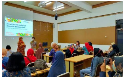
Gambar 3. Bimbingan Teknis Cara Penggunaan Akun Shopee