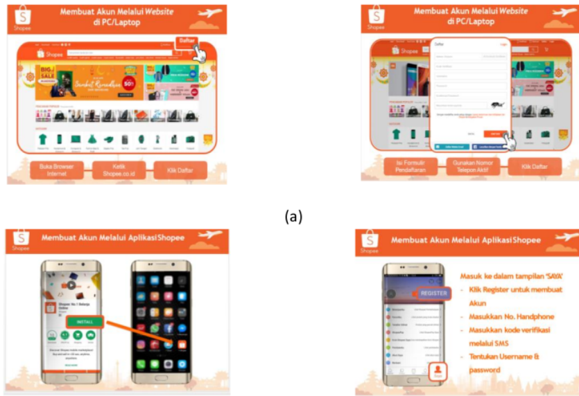
Gambar 1. (a) Tampilan Membuat Akun Melalui Website di PC/ Laptop, (b) Tampilan Membuat Akun Melalui Aplikasi Shopee

merupakan salah satu marketplace yang ada di Indonesia, pada saat pelatihan UMKM di ajarkan cara mendaftar sebagai anggota UMKM. Menciptakan keunggulan kompetitif, perlu mempunyai kemampuan untuk memanfaatkan kemampuan untuk menangani masalah tertentu sebagai kemampuan tumbuh dari waktu ke waktu, untuk memanfaatkan dan menciptakan sumber daya baru, seperti keterampilan untuk memanfaatkan teknologi, atau untuk membuka peluang baru untuk pengembangan jenis baru produk. Sebuah perusahaan dikatakan memiliki keuntungan kompetitif ketika perusahaan melaksanakan strategi penciptaan nilai yang pada prosesnya akan menghasilkan tenaga-tenaga profesional. Akhirnya, hasil kinerja yang unggul dan keunggulan dalam produksi mencerminkan keunggulan kompetitif (Saori et al., 2020)