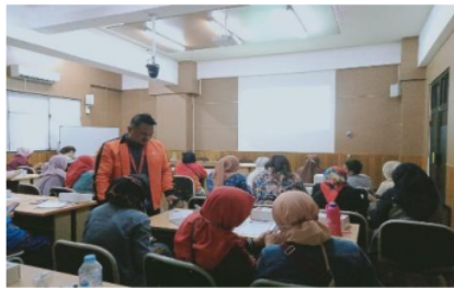
Gambar 2. Pelatihan Pembuatan Akun Shopee bagi UMKM