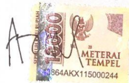
Nabila Az'zahra maharani