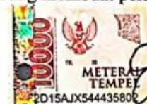
ELVIA NURUL 'AINI