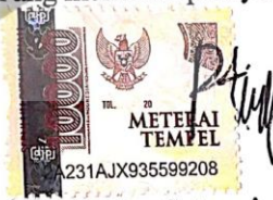
Putri Eka Setyaningrum