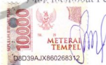
FASREEN ANGGIA MAISYITA