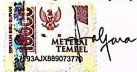
Zalfaura Thursina Salsabila S

Surabaya, 22 April 2022 Yang membuat pernyataan