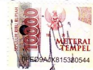
Syovi Ulfa Septia

Surabaya, 18 Desember 2020 Yang membuat pernyataan,