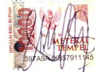
JULIA MICHELLE SUBYAKTO

Surabaya, 14 April 2022 Yang membuat pernyataan,