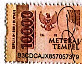
Izzul Nurul Fitani