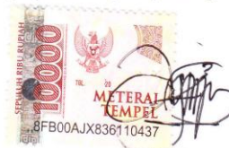
Nirma Agni Raha Neta

Surabaya, 16 Maret 2022 Yang membuat pernyataan,