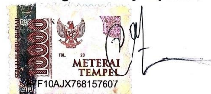
Intan Iona Putri