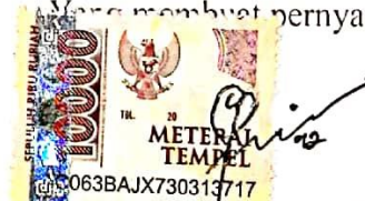
Citra Ayu Paramita Tjahya