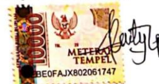
Laily Tia Pradilla