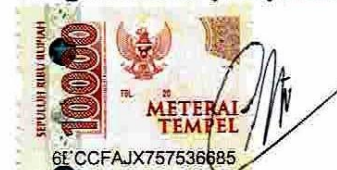
Eka Fitri Nabela