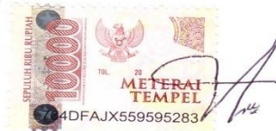
Vebe Novelia Buntoro

Surabaya, 26 November 2021 Yang membuat pernyataan,