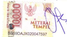
Diajeng Rodiatul Fadilah