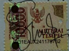
Savira Isnaini Nabila