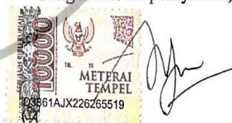
Putri Ayu Larasati