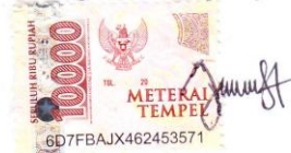
Dian Nuryuliati Pratiwi

Surabaya, 17 September 2021, Yang membuat pernyataan,