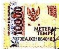
BAKTI SUSILO EFFENDI