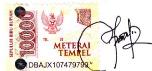
Yuyun Eka Wahyuningtyas