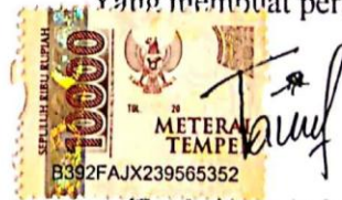
Tavia Nur Azizah