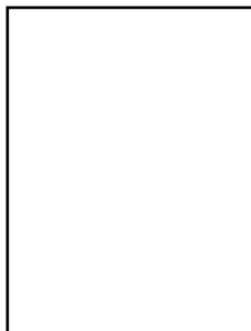
Widyanto Rangga Surbekti